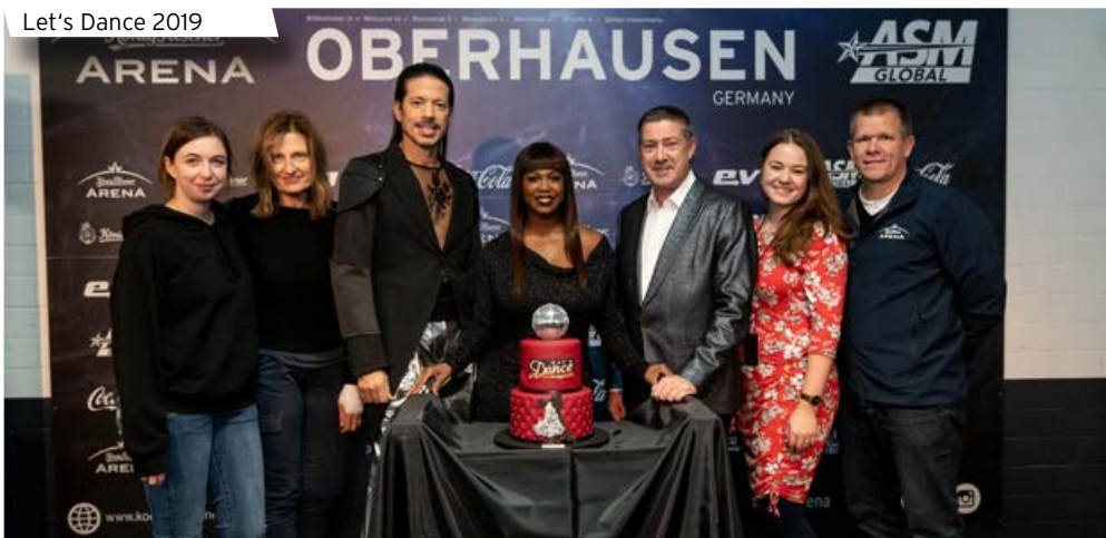
Let's Dance 2019