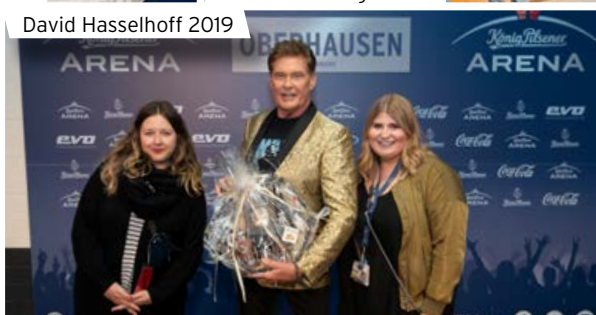
David Hasselhoff 2019