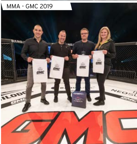
MMA - GMC 2019