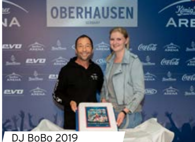
DJ BoBo 2019