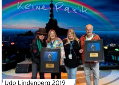
Udo Lindenberg 2019