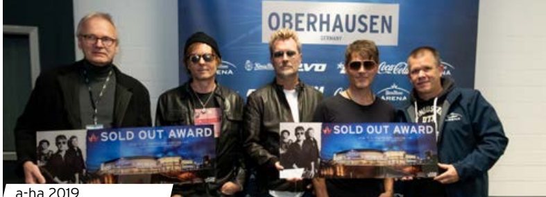
a-ha 2019 Ralf Schmitz 2019