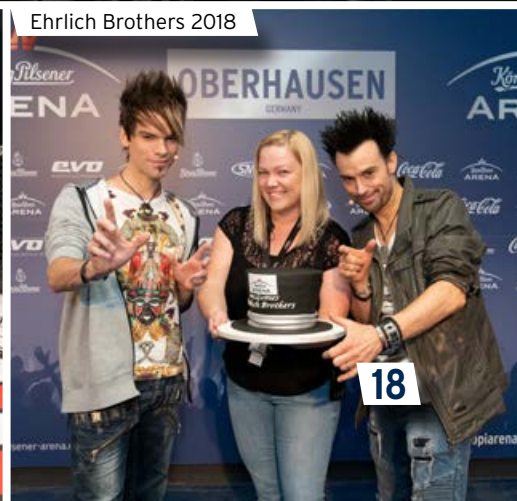
Ehrlich Brothers 2018